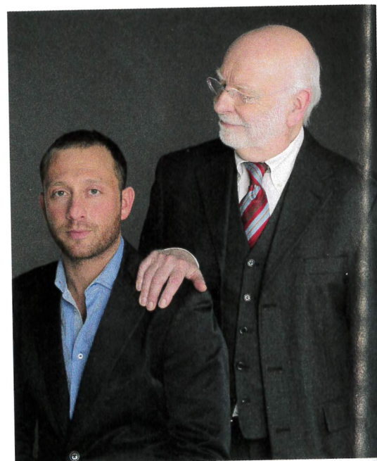
La Maison Celinni, diamantaire depuis 6 générations.